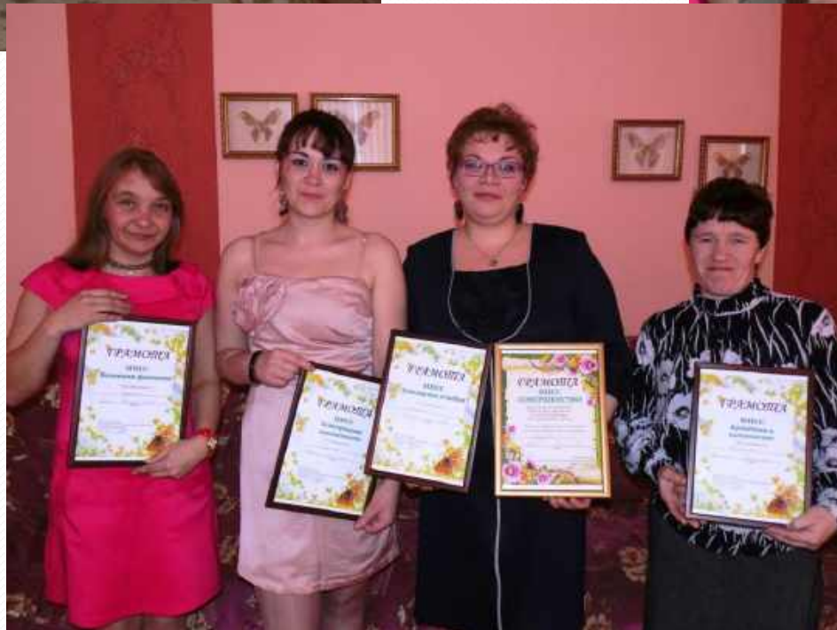
Семьи принимают участие в конкурсах