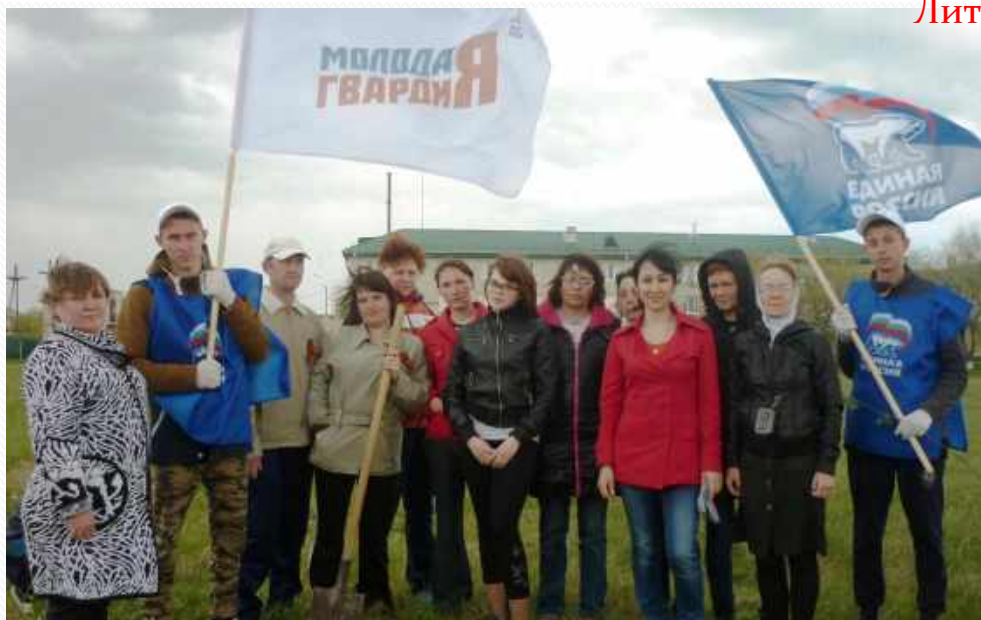
Акция «Лес Победы»