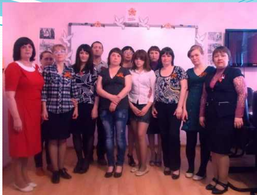
Литературная композиция «Дети войны»